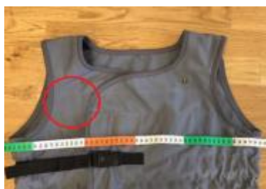
Måttagning största måttet för storleken. Inget av kardborrbandet syns.