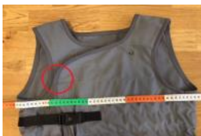
Måttagning minsta måttet för storleken. Ingen överlappning av sömmarna.