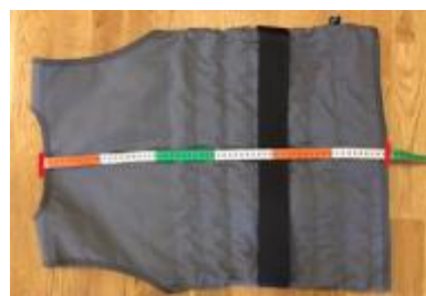
Måttagning längd mitt bak.